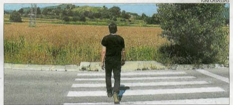
Una instantània de l'audiovisual «Ruralitats», obra de Ricart i Casassas

► L'origen etimològic de la paraula cultura emana «de cultivar», i per tant «la seva procedència és rural», recorda Ricart, que posa en relleu la paradoxa que suposa l'apropiació d'aquest mot per part del món urbanita. La dinamitzadora cultural de Llobera vol recuperar el sentit primer de la paraula.